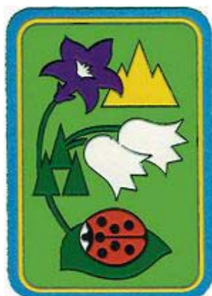
Coccinella della montagna

Allegato 2 Elenco delle specialità Amico degli animali Amico della natura