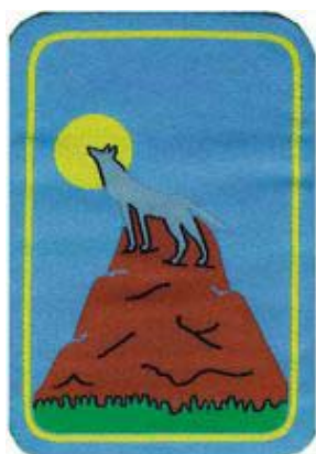
3° momento: Lupo anziano