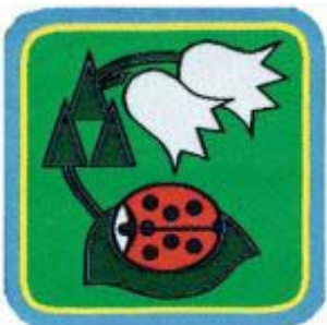
Coccinella del bosco