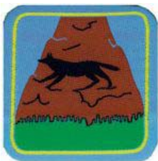
2° momento: Lupo delle rupe